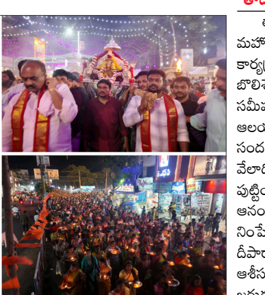
శాడేపల్లిగూడెం, మార్చి 21 (తెలుగు రాష్ట్రం ప్రతినిధి)