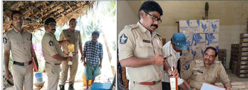
దీ సరసాపురం, మార్చి 21 (తెలుగు రాష్ట్రం విలేఖరి):