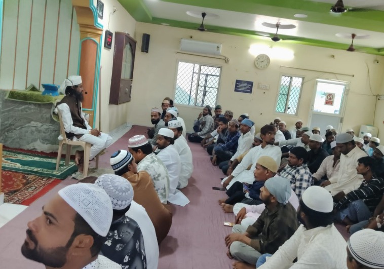
కోరుకొండ మార్చి 21(తెలుగు రాష్ట్రం విలేఖరి)