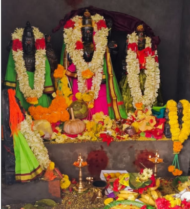
జీలుగుమిల్లి, ( తెలుగు రాష్ట్రం ప్రతినిధి)