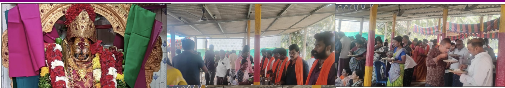
దీ సరసాపురం, మార్చి 21 (తెలుగు రాష్ట్రం ప్రతినిధి)

శ్రీ గ్రామ దేవత ముత్యాలమ్మ వారు 12వ వార్షికోత్సవం అంగరంగ వైభవంగా నిర్వహించారు. ఈ ఉత్సవాల్లో భాగంగా ఆఖరి రోజు శనివారం ముత్యాలమ్మ తల్లి ఆలయ ప్రాంగణంలో ఉత్సవ కమిటీ ఆధ్వర్యంలో అఖండ అన్న ప్రసాద వితరణ కార్యక్రమం చేపట్టారు. ఈ కార్యక్రమానికి వేల సంఖ్యలో భక్తులు హాజరయ్యారు. ఈ సందర్భంగా కమిటీ సభ్యులు మాట్లాడుతూ, దాతల సహకారంతో ఎప్పటిలాగే ఈ సంవత్సరం