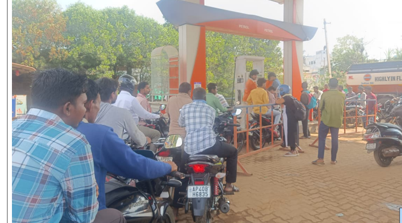
చింతపల్లి, మార్చి 21 (తెలుగు రాష్ట్రం ప్రతినిధి):

- వందతులతో ఒక్కసారిగా పెరిగిన డిమాండ్... తెల్లవారుజాము నుంచే వాహనదారుల బారులు. - జీసీసీ బంకులో నిల్వలు తగ్గడంతో ఉద్రిక్తత... ఒకే డిస్పెన్సర్ వద్ద రద్దీ. - క్యాన్లు, బాటిళ్లతో విక్రయాలపై నియంత్రణ కోరుతున్న ప్రజలు. - బంకు వద్ద ట్రాఫిక్ అంతరాయం... యజమాని పర్యవేక్షణలో పరిస్థితి అదుపు.