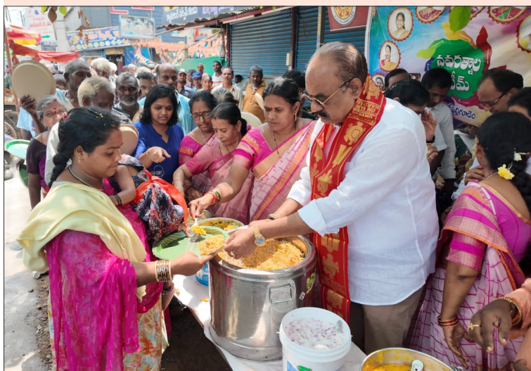
శాడేపల్లిగూడెం, మార్చి 21 (తెలుగురాష్ట్రం ప్రతినిధి)