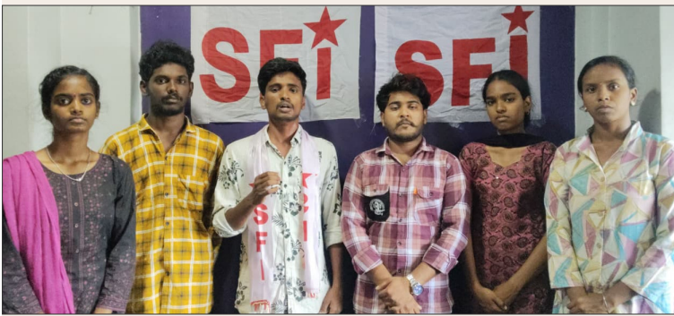
రాజమహేంద్రవరం, మార్చి 21: ( తెలుగు రాష్ట్రం ప్రతినిధి )

- ఫీజు వసూళ్లకు యాజమాన్యం బెదిరింపులు - హాల్ టికెట్లపై నిబంధనలు - అధికారుల నిర్లక్ష్య వైఖరిపై ఎస్.ఎఫ్.ఐ ఆగ్రహం