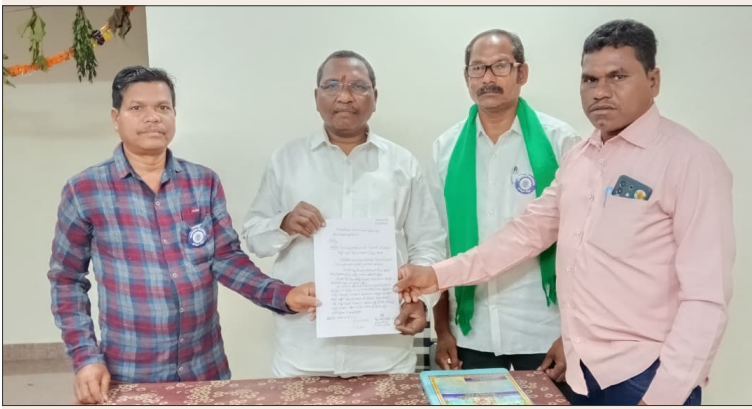
దేవపట్నం, మార్చి 21 (తెలుగు రాష్ట్రం విలేఖరి):

-ఎస్సీ కమిషన్ చైర్మన్ కి ఏపీ ఆదివాసీ జేపీసీ నాయకులు వివరాలను తెలిపారు..