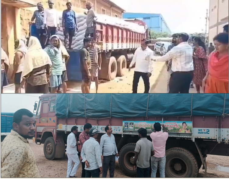
కాకినాడ, ఫిబ్రవరి 21 (తెలుగు రాష్ట్రం ప్రతినిధి):