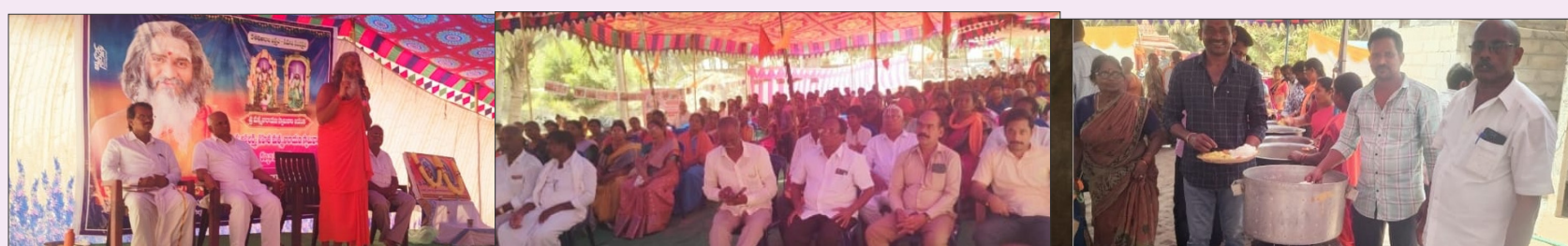
మొగలూరు మార్చి 21 (తెలుగు రాష్ట్రం విలేఖరి)

మండల పరిధిలోని పేరుపాలెం కనకదుర్గమ్మ బీసీ సమీపంలోని వేంచేసియన్న శ్రీశ్రీశ్రీమత్స్య నారాయణ స్వామి, శ్రీ అష్టలక్ష్మి సమేత ఆదిలక్ష్మి అమ్మవారి ఆలయంలో శనివారం శ్రీ మత్స్య నారాయణస్వామి వారి జయంతి సందర్భంగా మత్స్య నారాయణస్వామి, శ్రీ అష్టలక్ష్మి సమేత ఆదిలక్ష్మి అమ్మవారి వార్షిక కళ్యాణ మహోత్సవాలు ఘనంగా ప్రారంభమయ్యాయి. స్వామివారికి ప్రత్యేక పూజలు విఖనన స్తోత్ర పారాయణ, స్వస్తి పఠనము, విష్ణుక్షేప పూజ, పుణ్యహవచనం, కలశారాధన లు, పంచామృత అభిషేకం, ప్రధాన హోమం విశేషవర్షన మరియు మత్స్య గాయత్రి మంత్రం 108 సార్లు సామాజిక పూజలు నిర్వహించారు. అనంతరం ఉదయం 11 గంటల నుండి ఆలయములో శ్రీ