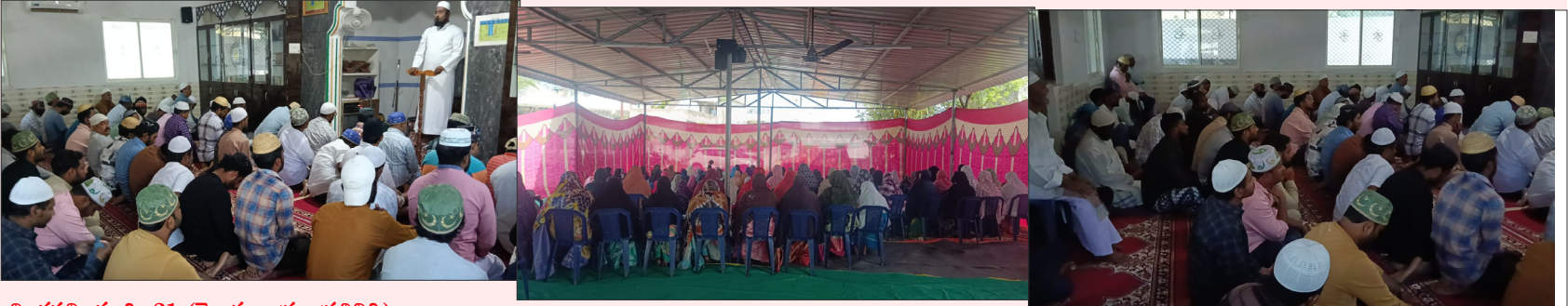
చింతపల్లి, మార్చి 21 (తెలుగు రాష్ట్రం ప్రతినిధి):

-నెలవంకతో ముగిసిన ఉపవాస దీక్షలు... ప్రత్యేక ఈడ్ నమాజ్తో ఆధ్యాత్మిక ఉత్సాహం. - మజిల్-ప-క్యూబా, తాజంగి మసీద్లలో భారీగా జమాత్... మహిళలకు ప్రత్యేక ఏర్పాట్లు. - జకాత్, ఫిత్రాతో దానధర్మాల పండుగగా ఈడ్... సాబ్రాత్వత్వానికి నిదర్శనం.