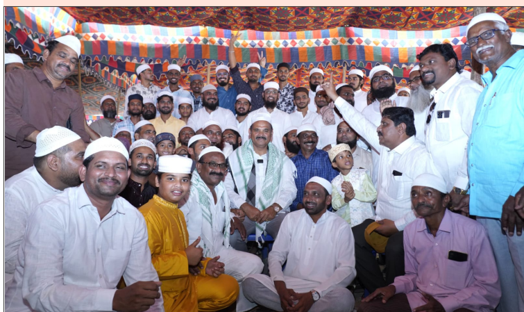
రాష్ట్ర మంత్రి కొలను పార్లమెంటు సూపీడు స్టూన్, మార్చి 21: తెలుగు రాష్ట్రం ప్రతినిధి.

-ముస్లిం సోదర, సోదరీమణులు భక్తి, శ్రద్ధలతో ఆత్మను శుద్ధి చేసుకుంటూ పేదలకు దాన ధర్మాలను చెయ్యడం పవిత్ర రంజాన్ మాసం ప్రతీక.-ఈ ధాటో పాల్గొని పార్లమెంటు చేసే ముస్లిం సోదరులకు రంజాన్ శుభాకాంక్షలు తెలియ జేసే మంత్రి.-రంజాన్ ముందే స్వంత నగదుతో సుమారు రూ 15 లక్షలతో రంజాన్ కానుకలు అందజేశాము.