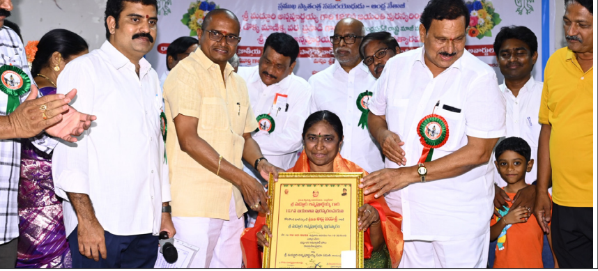
కోరుకొండ మార్చి 21(తెలుగు రాష్ట్రం విలేఖరి)